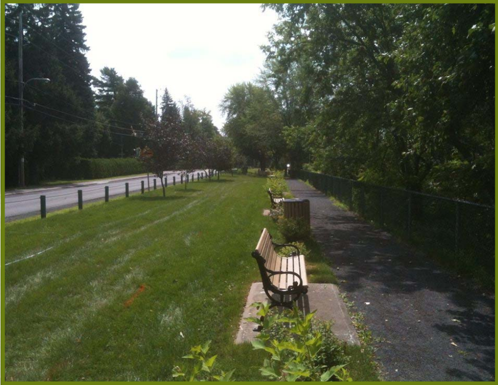
Une section du Parc Michel-Chartrand sera bientôt transformée!

La tourbe enlevée, la terre de plantation servira à former de petites buttes.